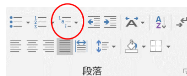
図 2 アウトライン